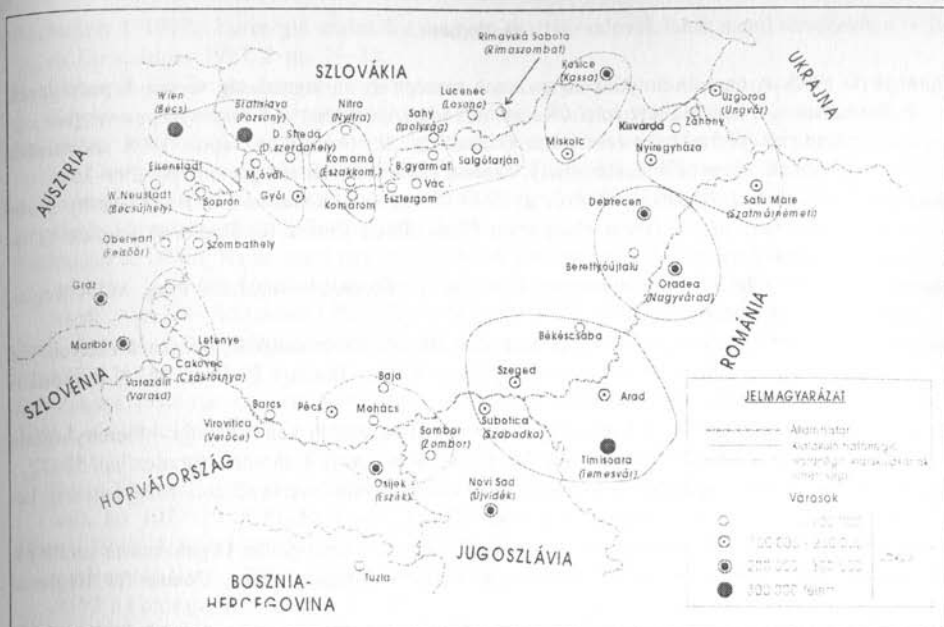
4. ábra. Potenciális és formálódó határregiók, interregionális együttműködések Forrás: MTA RKK Nyugat-magyarországi Tudományos Intézet, Győr

A Kárpátok Eurorégió egy országnyi területet és népességet kíván átfogni, miközben a szervezetet alkotó területi egységek nem rendelkeznek számottevő erőforrással a kapcsolatok elemi egységeinek fejlesztéséhez sem. A keleti-délkeleti államhatárok szláv térségében hasonló nehézségekkel küzd a Duna-Körös-Maros-Tisza multiregionális együttműködés is. A két óriásrégió példája is arra int, hogy célravezetőbb a város-város, kistérségi és településközi kapcsolatrendszer erősítése, mert ezek stabilitása esetén a nagyobb együttműködések biztosabb alapon működhetnek. Az egykori történelmi Bihar magyar és román oldali területeinek együttműködése ebből a szempontból is példaértékű lehet, különösen ami a trianoni határok által mesterségesen elválasztott, illetve szétszakított gazdasági, infrastrukturális és egyéb, egykor szervesen összetartozó térségi funkciók szorosabbra fűzését, tágabb értelemben pedig a határon átívelő kapcsolatok erősítését illeti az egységesülő Európában. A ma még meglehetősen inkább csak kvázi eurorégióként tevékenykedő két bihari interregionális együttműködés, a Hajdú-Bihar-Bihar és a Bihar-Bihar Eurorégió a határ menti hosszabb távra szóló kistérségi kapcsolatok fejlődésének mindenesetre ígéretes kiindulási bázisa lehet a jövőben.