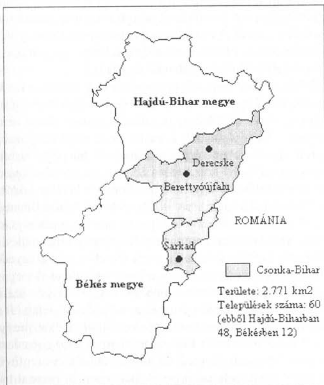
3. ábra. Az egykori Bihar vármegye az 1949/50-es közigazgatási reform után

együtt 60 bihari település – elszakadt addigi természetes központjától, Nagyváradtól , s centrumközeli helyzetből egy periférikus, halmozottan hátrányos helyzetű, igencsak elszigetelt terület, az ún. Csonka-Bihar, vagy az akkoriban ugyancsak elterjedt kifejező szófordulattal a „maradék Biharország” része lett (3. ábra).