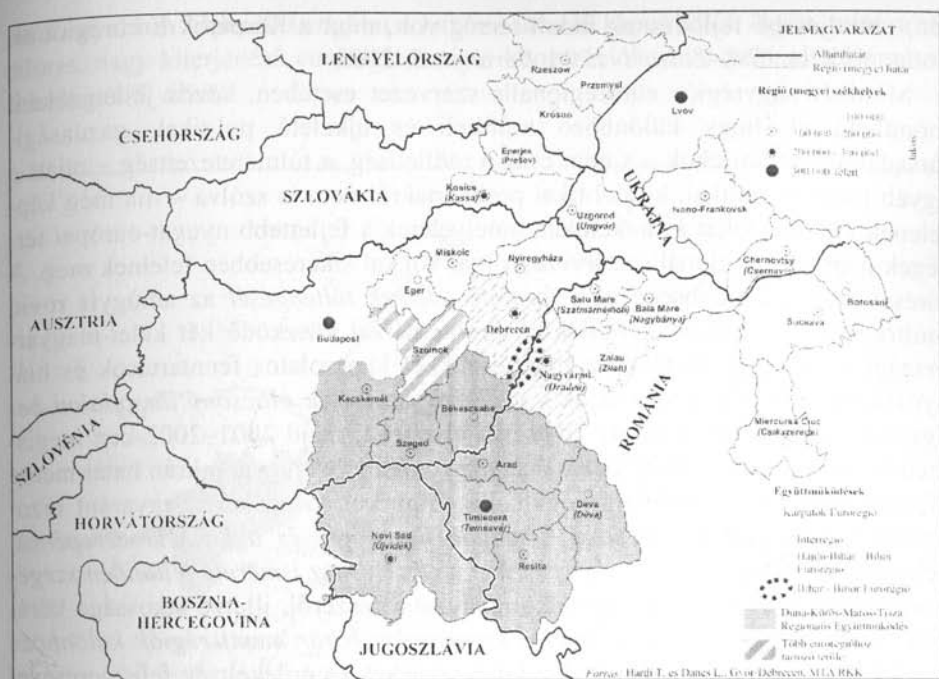
1. ábra. Eurorégiók és határon átnyúló regionális együttműködések Kelet-Magyarország részvételével 2002-ben

Megint más kérdés, s ez részben a helyi kezdeményezések és együttműködések szintjén jobban működő DKMT Eurorégió esetében is igaz, hogy a hatalmas területi kiterjedés, az együttműködés viszonylag nagy területe önmagában is nehezíti az érdemi együttműködést. Különösen érvényes megállapítás ez a Kárpátok Eurorégióra, amelynek viszonylag óriási méretei (161 000 km 2 , 16 millió lakos) egy jelentősebb nagyságú ország területét teszi ki, mintegy kéttucat közigazgatási egységére kiterjedően, olykor nem is szomszédos országokkal érintkezve, már-már pusztán emiatt is a működésképtelenség felé sodorják a szervezetet. Igaz a DKMT Eurorégió is viszonylag nagy területet (77.000 km 2 ) fog át, és közel 6 millió fős népességet érint, de ez mégiscsak „kezelhetőbb” nagyságrend, mint a Kárpátok Eurorégióé. Arról nem is szólva, hogy a négy magyar megyét (Jász-Nagykun-Szolnok, Csongrád, Bács-Kiskun, Békés), a négy román megyét (Krassó-Szörény, Temes, Arad, Hunyad) és a Vajdaság tartományt magában tömörítő DKMT Eurorégió az együttműködés szorosabb és konkrét formáját képviselve mind természetföldrajzi, mind gazdasági-társadalmi jellegét tekintve – Trianon előtt voltaképp egy ország területéhez tartozva – régtől fogva homogénebb, s már történelme során is (pl. az Osztrák–Magyar Monarchia ide-